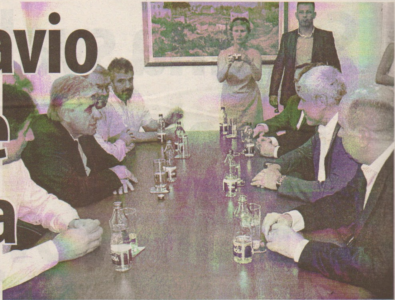
SRBIJA I CRNA GORA TREBA DA BUDU U NAJBOLJIM ODNOSIMA: Tadić u Herceg Novom

Za predsjednika Srbije je dobra vijest što u Novom ima turista, jer je čuo da je u drugim primorskim opštinama došlo do pada posjete.