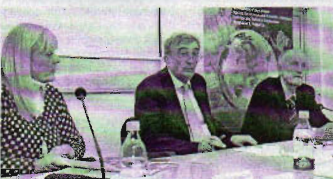
KORUPCIJA UGROŽAVA DEMOKRATIJU: Sa jučerašnjeg seminara

- Najopasnije stanje jednog političkog poretka je kada se korupcija organizovano širi u sve sfere i postaje način života - objasnio je Ćupić, dodajući da se u društvu u kojem se potrebe i interesi zadovoljavaju na koruptivni način dovode u pitanje univerzalne vrijednosti, pravda, opšte dobro i