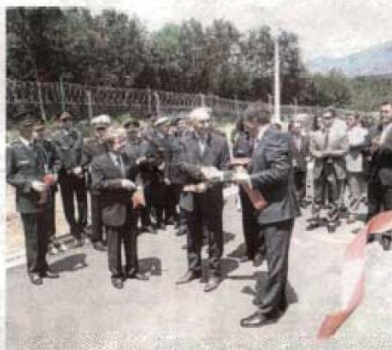
Juče sa otvaranja skladišta u Danilovgradu

On je naglasio da su radovi završeni za manje od godinu dana, te da je dobijen objekat kapaciteta 1.250 tona za smještaj municije po svjetskim standardima. Vučinić je istakao da se realizacijom ovog projekta dobio značajan objekat za Vojsku Crne Gore, ali i ono što je mnogo važnije da je značajno pojačana bezbjednost