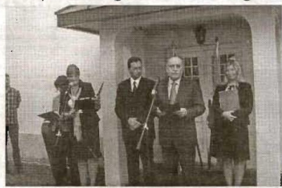
Стартовала нова генерација дипломата