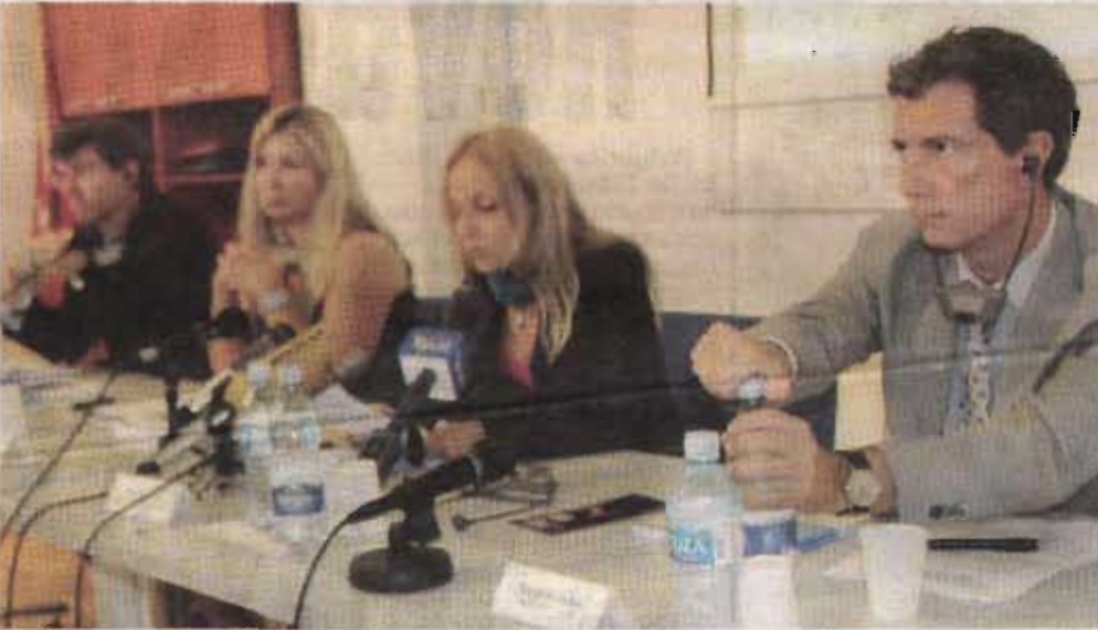
Poslije Kosova, građani Crne Gore najviše daju za mito

"U više od polovini slučajeva, javni službenici su napravili određeni zahtjev za novac, dok je 40 odsto ispitanih priznalo da su sami dali mito", rekao je Jandl.