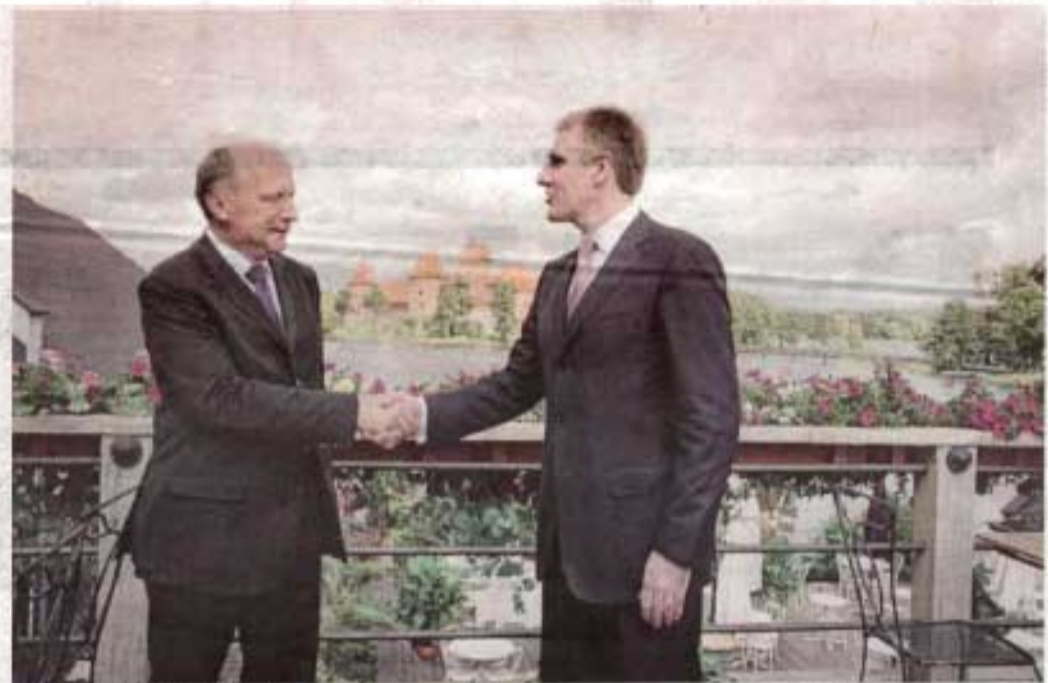
Andrius Kubilius i Igor Lukšić

- Riječ je o malim zemljama, malim ekonomijama, pa je interesantno čuti iskustva Litvanije kako se nosila sa poteškoćama u tom smislu i kako danas odgovara na izazove krize. Vjerujem da je moguće kroz komunikac-