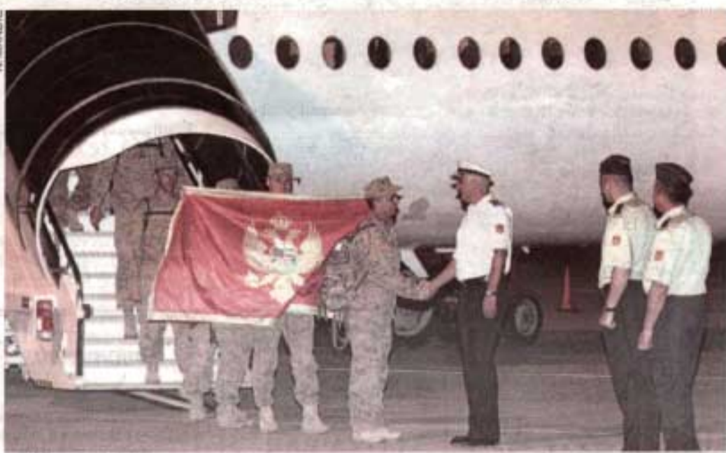
Sa dočela u Podgorici

- Svojim profesionalnim odnosom prema zadacima koji su pred vas postavljeni u okviru ove veoma složene misije pokazali ste da iako je VCG naj-