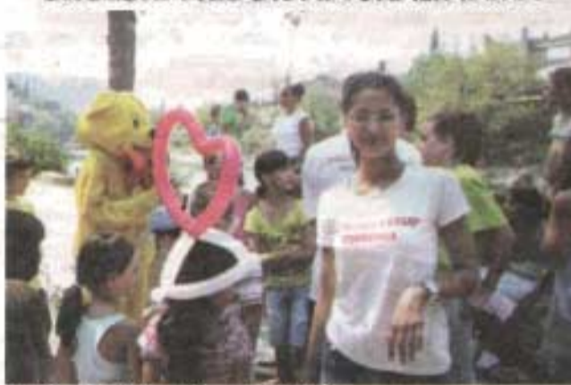
Mališani dobili poklone: Na Skalinama