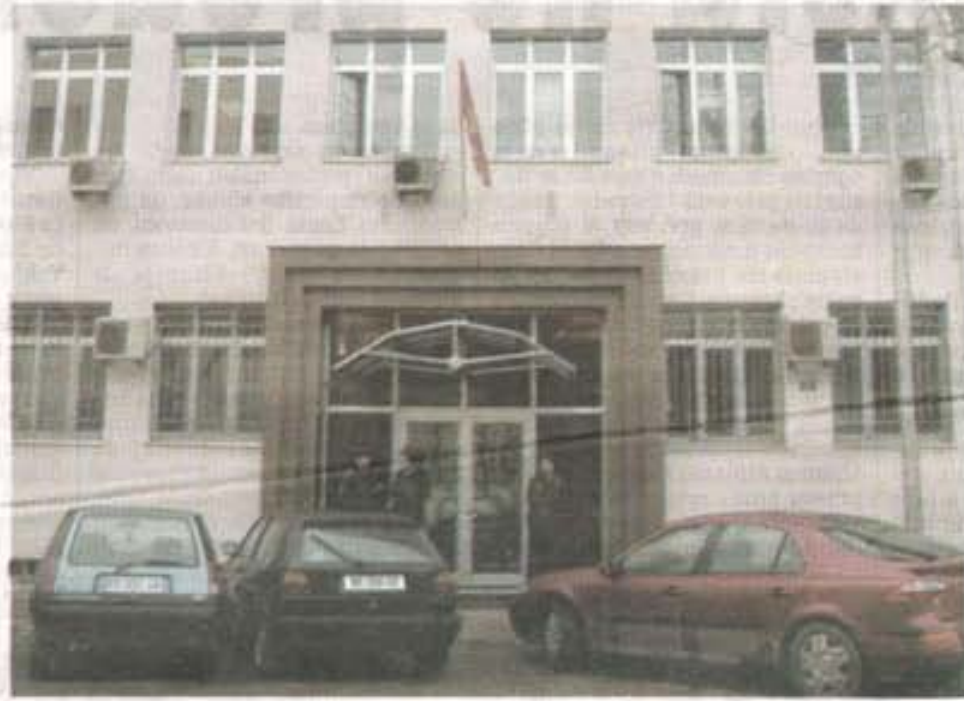
Pravda samo uz dubok džep: Viši sud u Podgorici

Pomoćnik ministra pravde Branka Lakočević objasnila je za "Vijesti" da je cilj donošenja zakona da se građanima olakša pristup