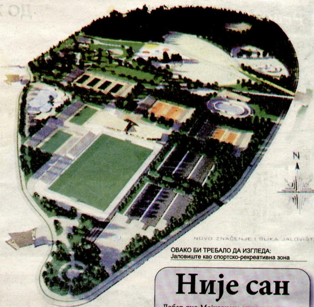
НЕКО ЗНАЧЕЊЕ ЈЕ БИЛА ЈАЛОВИШТА