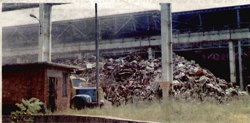
Deponija fabrike je crna ekološka tačka: Željezara u Nikšiću

NA DEPONIJU ŽELJEZARE NEUSLOVNO SMJEŠTENO VIŠE OD DVA MILIONA TONA OTPADA