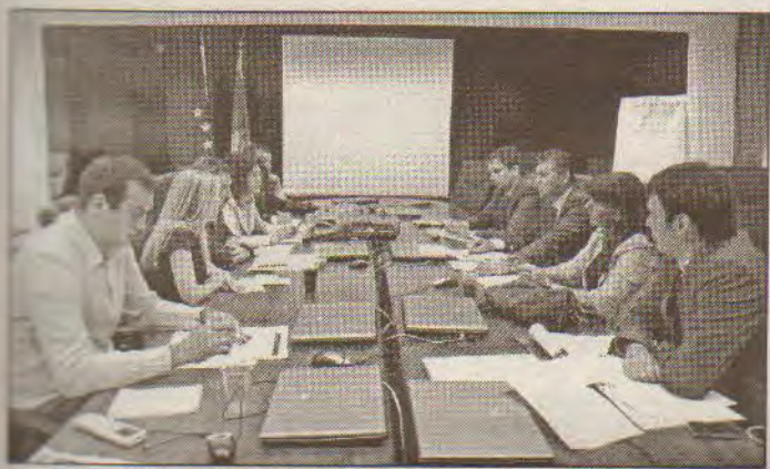
СА ЈУЧЕРАШЊЕГ КООРДИНАЦИОНОГ САСТАНАКА У ПОДГОРИЦИ

- Заједнички смо констатовали да увијек треба тражити још боља и квалитетнија законска рјешења, тако да ћемо уз помоћ УНДП-ија имати одређене савјетнике са интернационалним искуством који ће бити у прилици да заједно са нама анализирају постојећа рјешења и да радимо на њиховом побољшању. Један од елемената наше сарадње биће даље подизање капацитета не само у ресорном министарству већ и у локалној самоуправи како би били у могућности да сложене послове који су