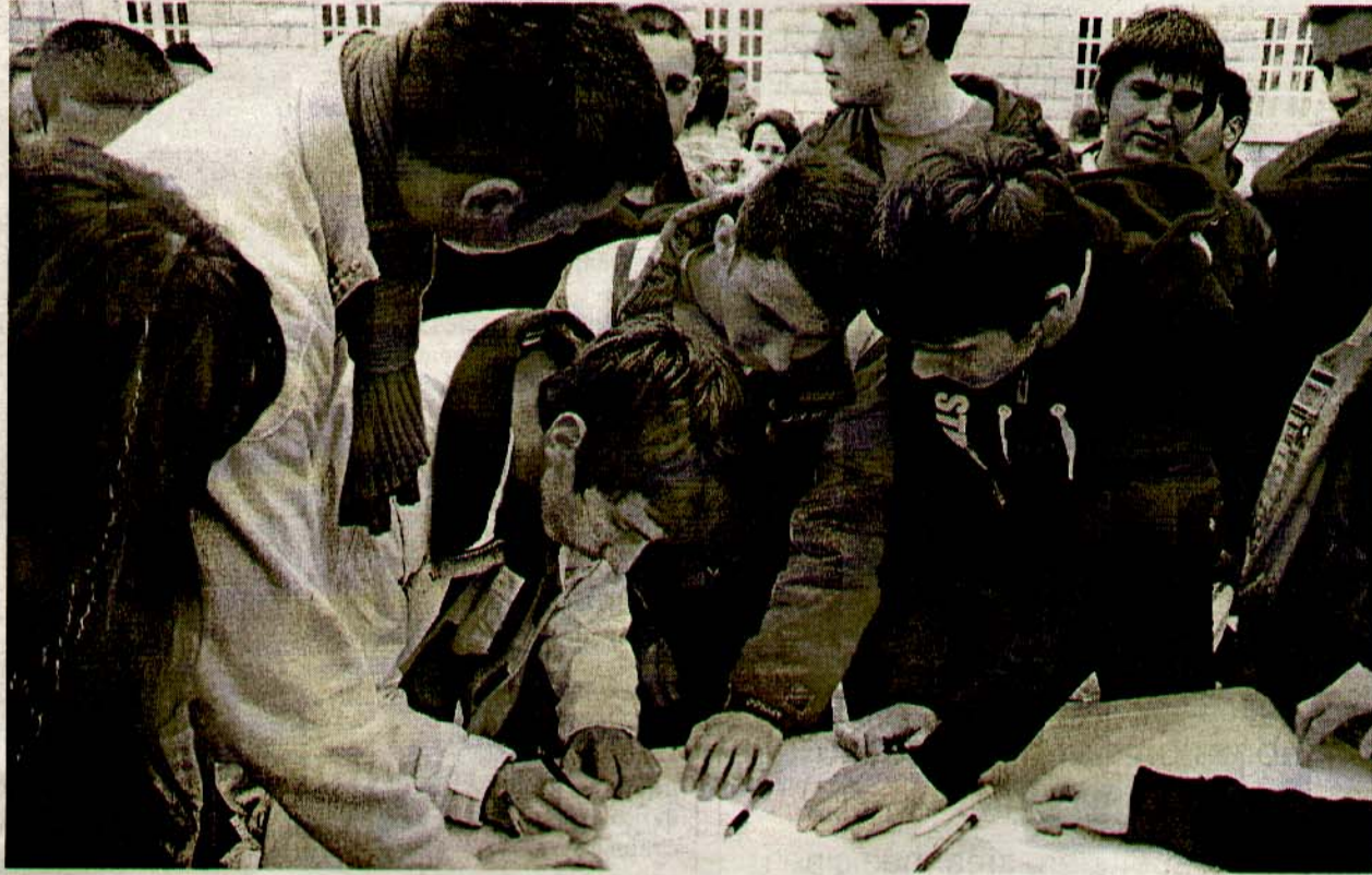
ОДЛИЧНИ УЧЕНИЦИ НЕЋЕ ПОЛАГАТИ МАТУРУ: Са потписивања петиције подгоричких гимназијалаца

Подгорица - Пропис по којем ће ученици четвртог разреда средњих школа полагаати матурски и завршни, односно стручни испит, објављен је у Службеном листу Црне Горе, тако да је са законске стране све припремљено.