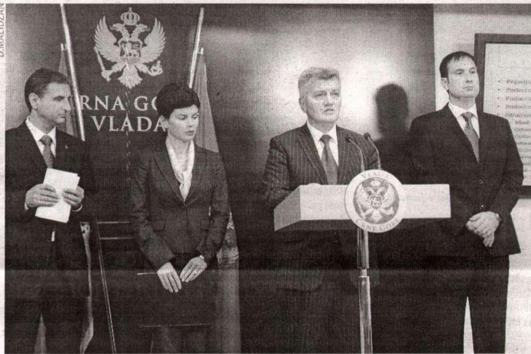
OSTVAREN KRUPAN NAPREDAK: Sa jučerašnje prezentacije

- Ohrabruju podaci da je u toku 2011. godine registrovano devet novih slučajeva HIV infekcije i jedna smrt od AIDS-a, kao i to da smo uspjeli da ostvarimo nizak nivo epidemije u zemlji na nivou 0,01 odsto. Međutim, razni faktori mogu uticati da se ova infekcija otme kontroli i zahtijevaju veće napore i angažman, posebno kad je u pitanju podrška okruženja onima koji su pogođeni HIV-om - naglasio je ministar zdravlja Miodrag Radunović, napominjući da je prioritarna obaveza borba protiv stigme i diskriminacije. Ministar Radunović je podsjetio da su uloženi veliki napori u borbi protiv HIV/AIDS-a, te da je izrađen veliki broj nacionalnih vodiča i protokola za sprečavanje i liječenje bolesti. Najvažnije ciljne grupe dobile su informacije o sprečavanju HIV-a, potreban materijal i usluge. Obučeni zdravstveni radnici, osoblje u zatvorima, vršnjački