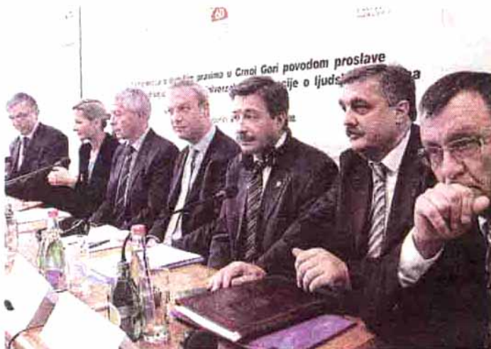
Конференција на правном факултету

Црна Гора мора што прије донијети Закон о забрани дискриминације, охробрити употребу мањинских језика, на прави начин у пракси примјењивати одредбе прописа у вези са родном равноправношћу. Држава мора обезбиједити једнакост пред законом, а један од кључних предуслова је брже рјешавање поступака пред судовима и обезбјеђивање правичног суђења у разумном року. Ово је само дио препорука упућених јуче на завршетку дводневне конференције на тему људских права коју су организовали Правни факултет и Тематска група УИ.