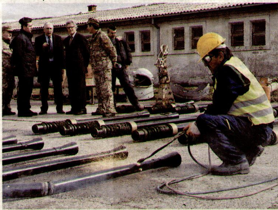
Akcija "staro za novo": juče u Danilovgradu

NASTAVLJENA AKCIJA ELIMINISANJA NAORUŽANJA