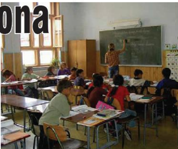
VAN SKOLE: Male šanse za bolju budućnost

Crnogorski Zakon o osnovnom obrazovanju propisuje obavezno i besplatno obrazovanje za sve. Zvanični podaci, međutim, pokazuju da čak više od polovine romske i egipćanske djece školskog uzrasta nije obuhvaćeno tim obrazovanjem. Fakultet je do sada upisalo 13 Roma, dok ih je u srednjim školama oko 35