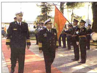
СА СВЕЧАНОЈ ДОЧЕКА НАЧЕЛНИКА ГЕНЕРАЛШТАБА ОРУЖАНИХ СНАГА РУМУНИЈЕ ЈУЧЕ У ПОДГОРИЦИ

ДЕЛЕГАЦИЈА ОРУЖАНИХ СНАГА РУМУНИЈЕ, КОЈУ ПРЕДВОДИ НАЧЕЛНИК ГЕНЕРАЛШТАБА АДМИРАЛ ГЕОРГЕ МАРИН У ЗВАНИЧНОЈ ПОСЈЕТИ МИНИСТАРСТВУ ОДБРАНЕ И ВЦГ