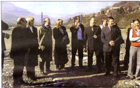
ЈУЧЕ У МОЈКОВЦУ